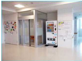
各階のデイルームには公衆電話と自動販売機を備えています