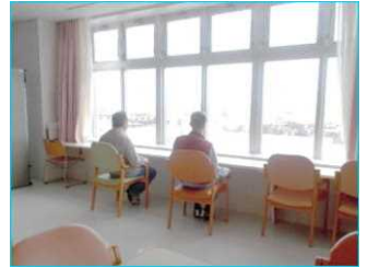
知床連山やオホーツクの海を望むことができます