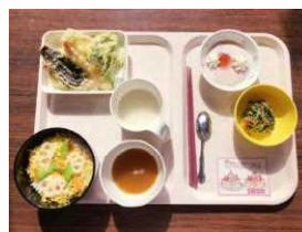
季節やイベントごとにメニューを工夫しています