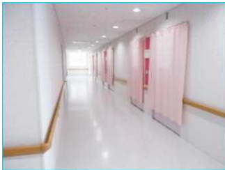
明るく静かで落ち着いて

急性期及び慢性期症状のある患者さまに治療・看護を行う病棟です。退院後どのような生活を送るかについて意思決定できるよう支援し、退院後安心してその人らしく生活できるよう援助します。