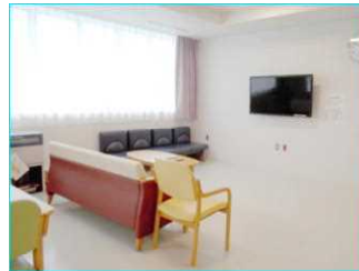
ゆったりテレビを鑑賞したり、