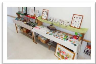
デイケア通所患者様作品